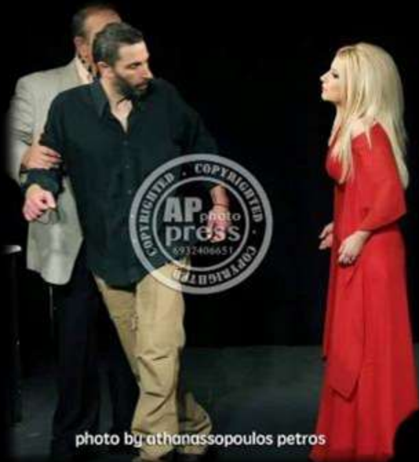
Θεόδωρος 2 Δεκεμβρίου 2015 στις 1:53 πμ

Την Κυριακή το βράδυ απόλαυσα την όμορφη αισθηματική κωμωδία Όλα για την Ελίζα στο θέατρο Λύχνος. Η παράσταση έχει ως κεντρικό θέμα τα όνειρα των ανθρώπων και την πίστη σ' αυτά παρά τις δυσκολίες και τις αντιξοότητες.. Η παράσταση συνολικά σου αφήνει μια γλυκιά γεύση καθώς τα παιδιά παίζουν υπέροχα, με χάρη και τρυφερότητα.. Την παράσταση γί άλλη μια φορά κλέβει ο ερμηνευτικός χείμαρρος Μάκης Αρβανιτάκης που μας ξεσηκώνει με το μπρίο και το ταπεραμέντο του..!